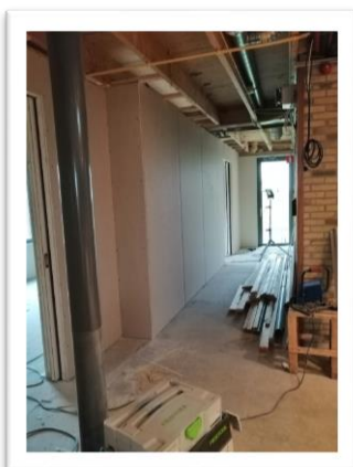
De nieuwe gang bekeken vanaf de toekomstige bar en vanaf de buitendeur achter naar de bar...

Verder zijn we bezig met o.a. het geluidsplan in combinatie met ringleiding, het verlichtingsplan, het meubilair en het realiseren van een geïsoleerde buitenopslag.