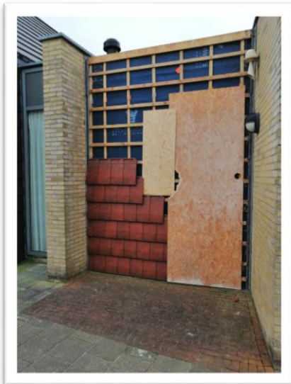
Gevelbekleding tijdelijk verwijderd i.v.m. aanleg afvoer herentoilet

Afgelopen week (de week van 11 januari '21) is er weer heel wat werk verzet in de Finne. De nieuwe wanden zijn nu tot en met de gipsplaat opgebouwd en de schuifdeuren (toegang keuken, toegang berging en toegang keuken naar berging) zijn gemonteerd. Ook is het regelwerk van de nieuwe wand van de heren-wc geplaatst. Een uitdaging doet zich voor om de nieuwe afvoer op het bestaande aan te sluiten: simpel onder de vloer is er niet bij vanwege de funderingsplaat die er ligt. Voor één gat niet te vangen, dus we gaan via een omweg. Vandaar dat nu ook de gevelbeplating aan de voorkant deels is verwijderd.