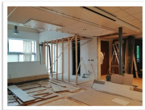
De contouren van het nieuwe herentoilet worden zichtbaar...

Verder zijn we bezig met o.a. het geluidsplan in combinatie met ringleiding, het verlichtingsplan, het meubilair en het realiseren van een geïsoleerde buitenopslag.