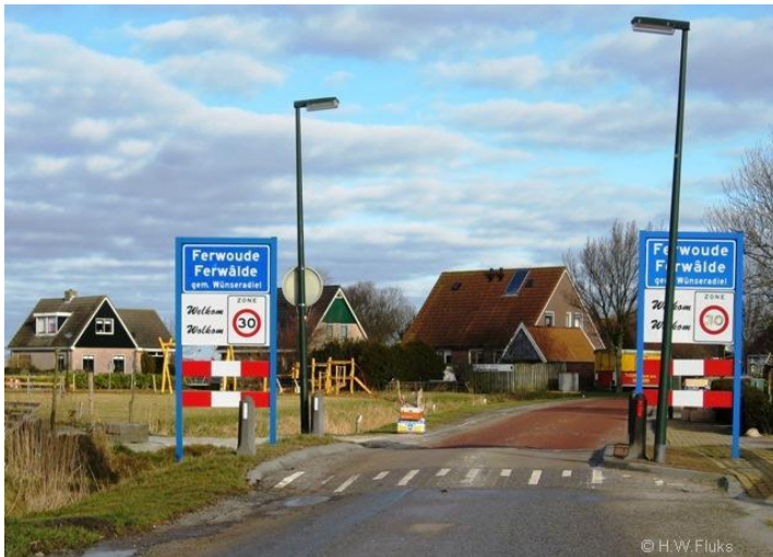
Binnenkomst Ferwoude vanaf Scharnebuursterweg / Workum