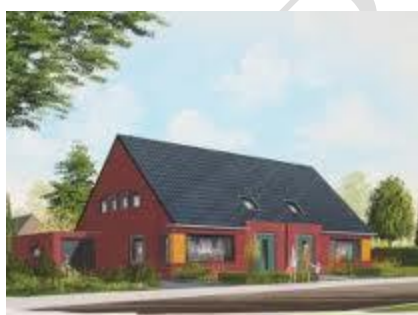
Art impression nieuwbouw 2^1 kap Djipwei

Het laatste nieuwbouwplan is zeer naar de wens van Dorpsbelang Ferwoude en bewoners gerealiseerd. Bewoners van Ferwoude werd de eerste kans geboden voor een woning, daarna mensen die een band met ons dorp hebben. Vervolgens inwoners van de voormalige gemeente Wûnseradiel en tenslotte iedere geïnteresseerde.