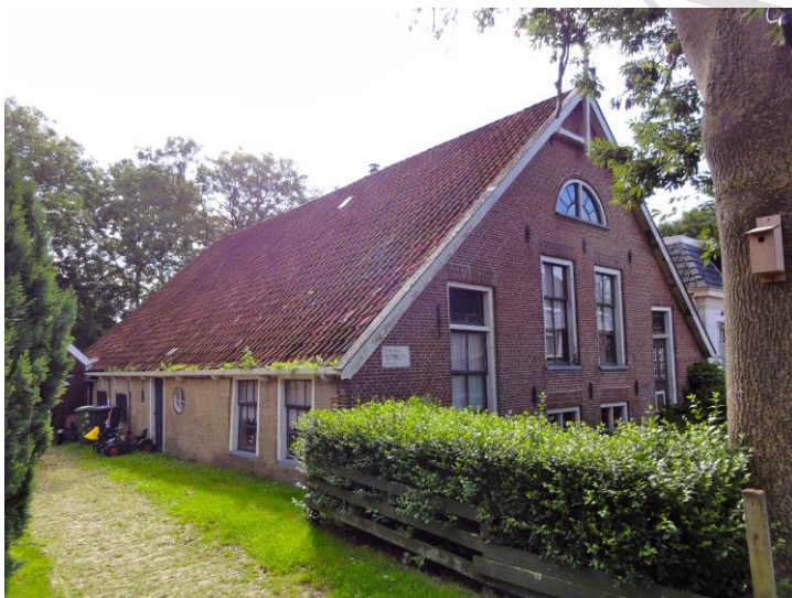
Timmerwerkplaats in centrum Ferwoude