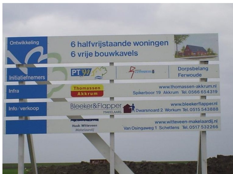
Aankondiging nieuwbouw 12 kavels

De helft hiervan in de afgelopen 10 jaar. Nieuwbouw werd meestal gepleegd vanuit vraag van de bewoners. Uitbreiding is geen doel op zich, echter wanneer er signalen komen van interesse voor nieuwbouw van bewoners of mensen die een band met het dorp hebben (de doelgroep), dan zal Dorpsbelang actie ondernemen. Dorpsbelang kan deze signalen actief (bijv. enquête) of passief (bijv. tips) opvangen.