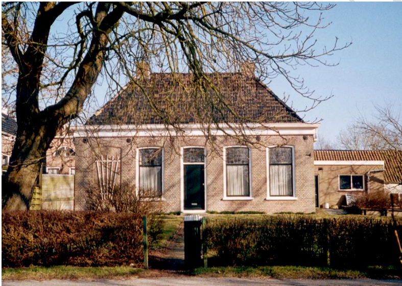
Dorpshuis De Djippert

De laatste jaren is weinig onderhoud gepleegd aan ons Dorpshuis en dit had diverse oorzaken. Onder andere een niet gerealiseerd plan dat samenwerking behelsde met de nieuwe basisschool. Dit kon wegens te kort tijdsplan en een niet enthousiaste gemeente Wûnseradiel niet doorgaan. We zijn echter nu op een punt aanbeland waarin in de Djippert moet worden geïnvesteerd, dit mede door verandering van regelgeving (rookbeleid, brandveiligheid). Verder is behoefte aan meer multifunctionele gebruiksmogelijkheden en is de keuken aan renovatie toe.