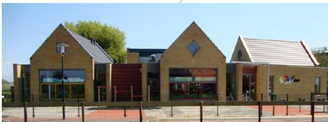
CBS de Finne heeft in 2011 nieuwbouw kunnen plegen op de bestaande locatie, www.finne.nl

Voor- en naschoolse opvang (VSO en BSO) zijn nog niet aan de orde, wel wordt tussenschoolse opvang (TSO) geboden. Ook aan de peuters wordt in het nieuwe gebouw onderdak geboden. Veel kinderopvang vindt plaats bij gastouders.